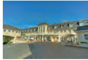
HOTEL LAHNSCHLEIFE WEILBURG