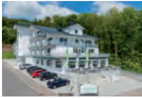
LANDHOTEL KRISTALL BAD MARIENBERG